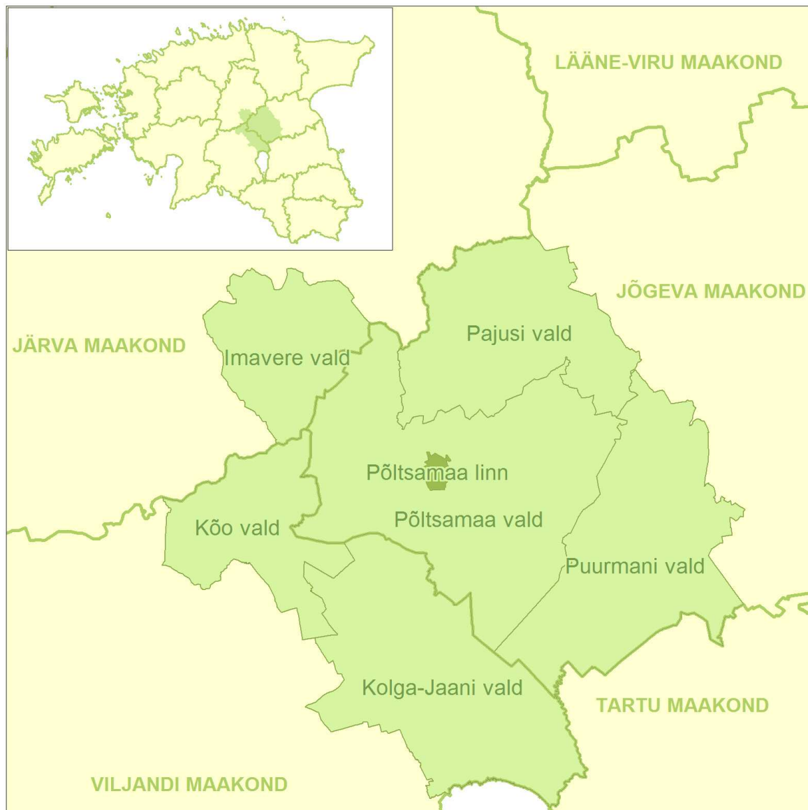
Joonis 1. Põltsamaa koostööpiirkonna asukoha skeem